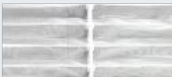
가로 세로가 균일한 구조