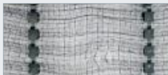
극세사 필터 대비 균일하지 않은 구조